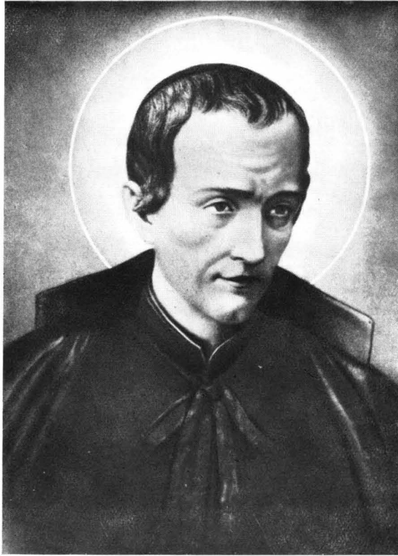
Pirotti Szent Pompilius 1710 – 1766.