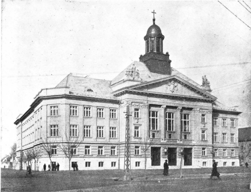
A nyár folyamán teljes befejezésre váro új gimnáziumi épület.