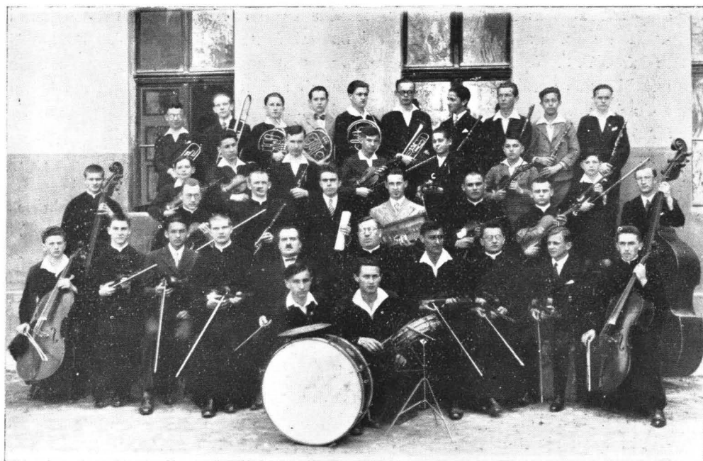
Az intézet szimfónikus zenekara.