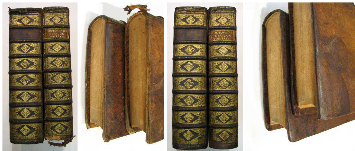
13. 282/5/2 1 kötet