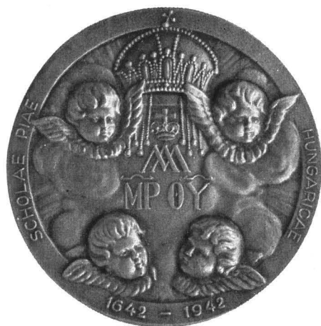
A piarista jubileumi emlék- és jutalomérem.