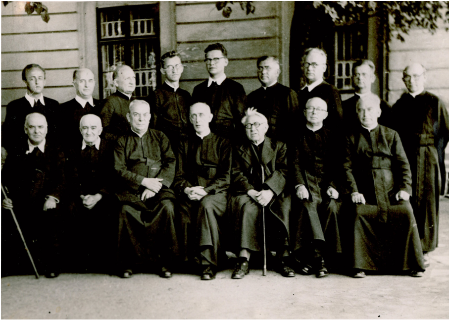
A nagykanizsai rendháznak a váci kényszertartózkodásra szállított tagjai a püspöki palotában