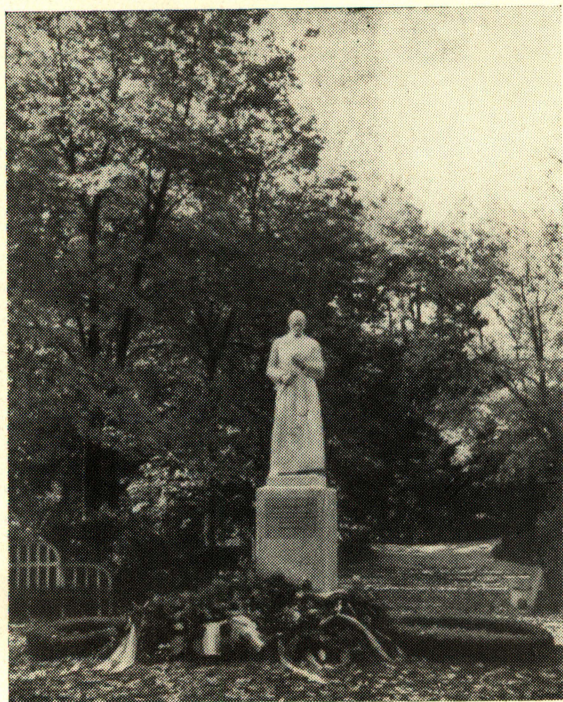
A szobor a leleplezés után.