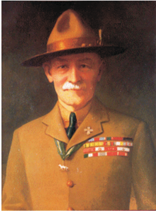
Baden Powell of Gilwell