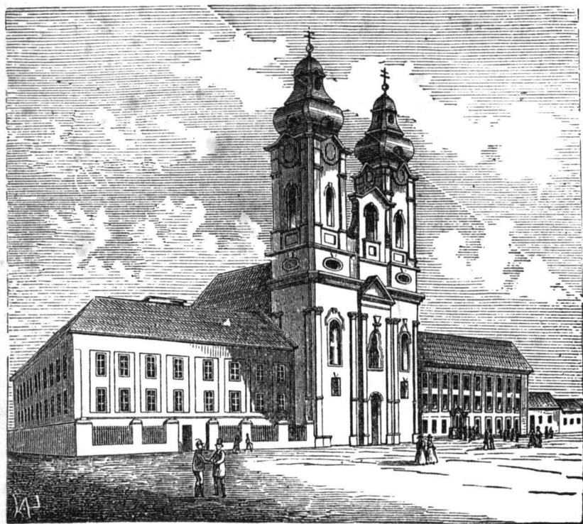
A kegyes-lanító-rend nyitrai társodája, temploma- s gymnásiumának az előtérre néző homlokrajza.