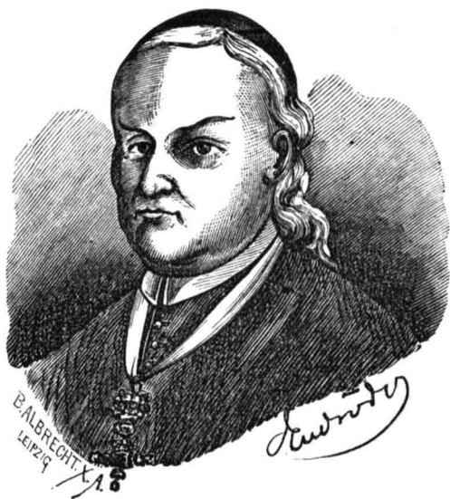
GUSZTINYI JÁNOS NYITRAI PÜSPÖK. SZÜLETETT 1712. - † 1777. JANUÁR 31.