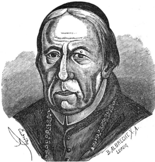
KLUCH JÓZSEF NYITRAI PÜSPÖK. SZÜLETETT 1748. — † 1826, DECEMBER 31.