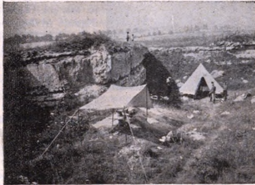
Az első tisztli-tábor. (Tétény, 1914.)

Park, parkirozott terület. Dróttal körülkerített pusztaság. Parkirozni: Vesd össze csörtetés, Vad Bivaly cikkeinket.