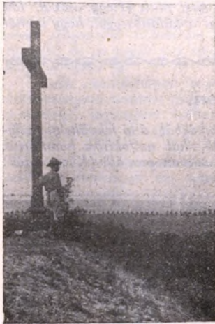
A tábor keresztje.

Táborozás! Varázslatos csudás szó te, melyre megdobban a szíve, elszorul a torka szerte az országban száz és száz testvérnek: lázas izgalom fog el neved hallatára. Tarka álmok, tábori képek pillangó módjára kergetik egymást lelkemben: tábortűz, takarodó, holdvilág, napsugár, zöld erdő, madárdal, játékzaj, víg kacaj, zászlók lobogása, kürtök harsogása, víg nóta, őrködés, munka és imádság . . . milyen gazdag élet, milyen szép egy élet! Szinte öntudatlanul, mozdulni, lépni, járni kezdek, nagy buzgóság, tennivágyás visz, ragad magával, azt hiszem, máris a táborban vagyok.