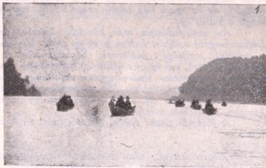
Az 1923-i vízi vándortáborból.

vagy raj intim keretében, bizalmas baráti körben megbeszélésre kerül, ami a gyóntatószék, a templom és a lelkiismeret megszentelt levegőjében játszódik le: az nem kíván bemutatkozni a nyilvánosság előtt. A cserkészlet eleven élet, amelyet nem lehet igazán megrögzíteni, amelyet csak egyféleképpen lehet megismerni: ha átéljük. Aki meg akarja ismerni cserkészletünket, jöjjön közénk, éljen velünk táborunkban, ismerjen meg bennünket ott, ahol ott-hon vagyunk. Bízunk benne, hogy ha megismeri a cserkészletet, meg is fogja szeretni.