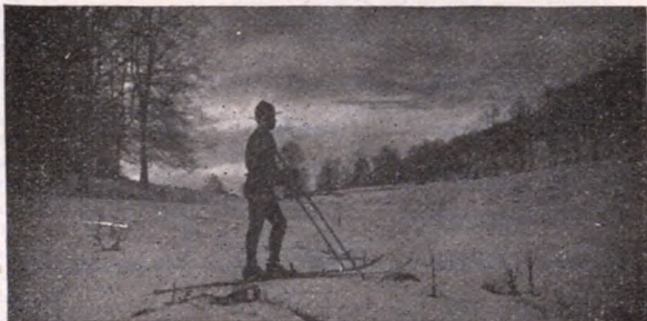
A Sztrilich Tamás-raj téli-táborából. (1922.)

Táborozásaink fejlődését e tíz év alatt e következő áttekintés mutatja: