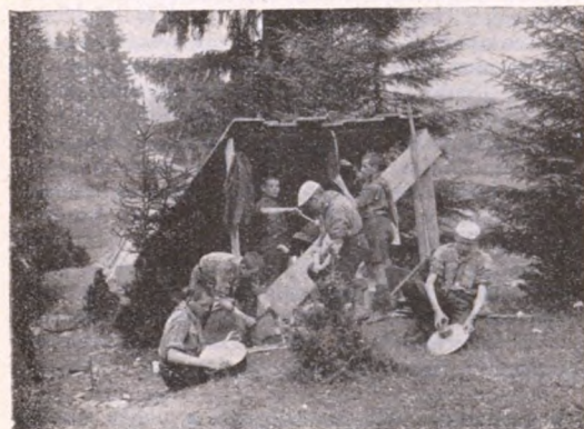
Konyha a breznóbányai táborban.