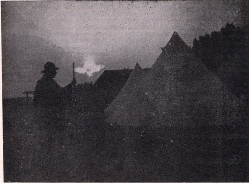
Éjjeli őr Balatonszemesen (1918).

Végre valamennyien együtt vagyunk a máglya körül, amelyre friss nyalábokat dobnak a calefactorok. Szükséges is, mert a tábori orvosfőnököknek nagy világosság kell. A töviseket szedi ki belőlünk. Csak most látom, hogy csupa vér a két tenyerem. Tehát innen volt a ragadosság! A fejből is kiszednek egy tucatra