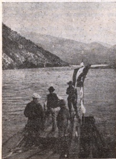
Megy a tutaj.

Vigan fiúk, cserkészfiúk, Föl a fejet merészen! A lábunk lépjen peckesen, Szemünk a magasba nézzen! Szeliden bűg a vadgalamb Az őrsünk zászlaján. A cserkész bátor és derék, Gyengéd, erős, vidám.