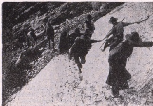
A Schafberg megmászása. (1923.)

Leng a zászló, szól a sip Fel fiúk! Irt az orma vén hegyeknek És a messze rengetegnek Mélye zúg. Bércoromra tűz a napfény Bérc fölött a fejedelmi sas kereng. És a szellők ajka zeng. Uccu, pajtás, mind miránk vár odafent. Hegyek-völgyek füje-fája, Friss virága, A jó Isten szép világa Uccu, pajtás, mind mienk!