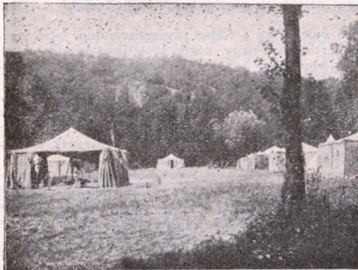
A csurgói tábor (1921).

velük közösen éltük végig, de a szellem tekintetében a mi tujajunknak, illetve a mi sátrainknak megvolt a saját egyénisége, amely árnyalatokban különbözött a többiekétől és hatását éreztette az egész nagy közösségben is. Nagyon nehéz volna pontosabban meghatározni, miben állott ez a szellem, ezt inkább